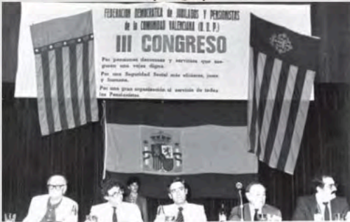
1983 - III Congreso de la Federación de Valencia