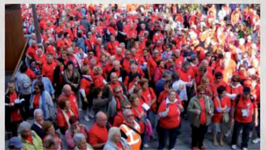
2011 - Marcha Guipúzcoa