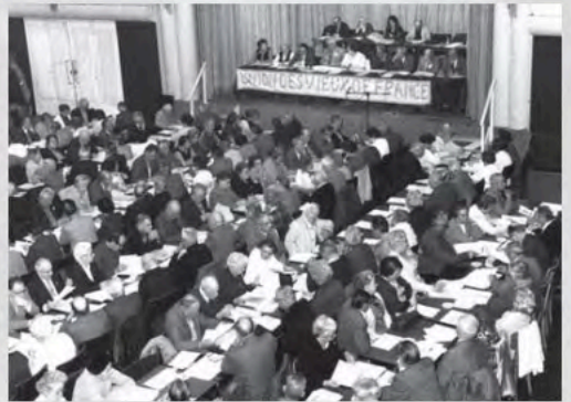
Años 80- Union de Mayores de Francia