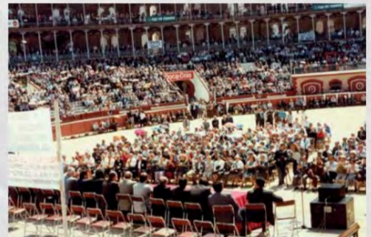
1990 - X Congreso Confederal en Tarragona