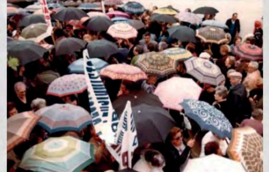
Década de los 90 - a pesar de las inclemencias del tiempo