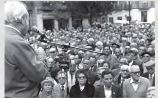
1980 - Mitin