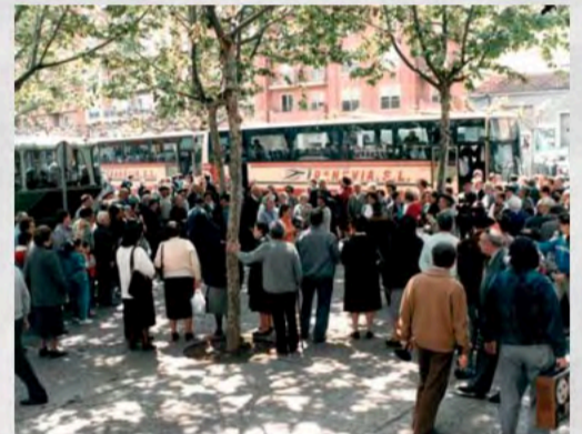
1988 - IX Congreso Confederal en Logroño