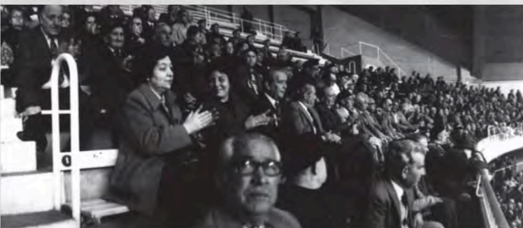
1978- clausura del II Congreso en el Palacio de los Deportes de Madrid