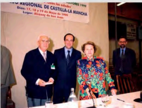
1999 - Con José Bono pdte de Castilla-La Mancha