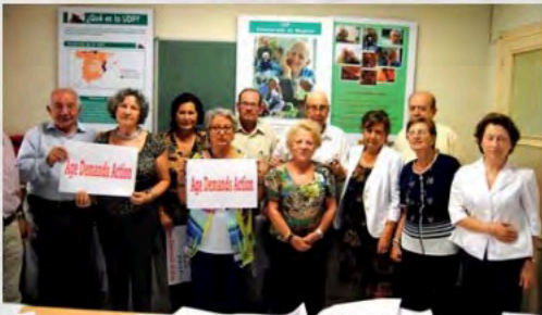
Apoyo a Campaña Internacional ADA