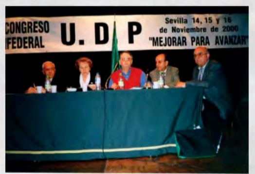
2000 - XV Congreso Confederal en Sevilla