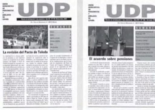
Boletines de UDP