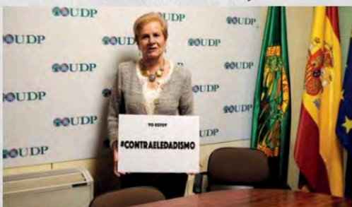
2016 - Campaña contra el edaismo