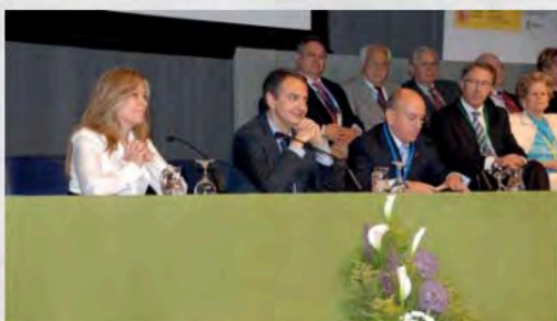
2009 - 3er. Congreso del Consejo Estatal de Personas Mayores