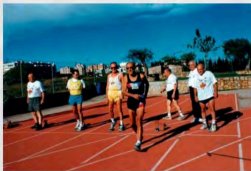
1998 - IV Olimpiadas de Mayores Valencia