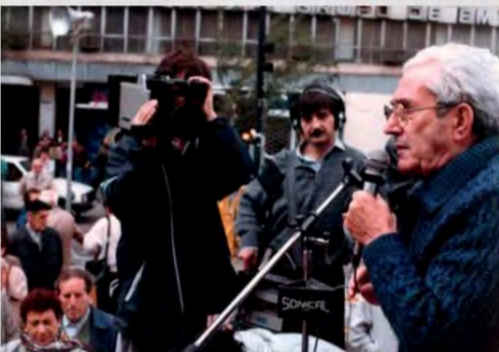
Marcelino Camacho se dirige a manifestantes de UDP