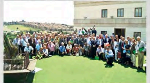
2015 - XLV Asamblea General de UDP en Ávila