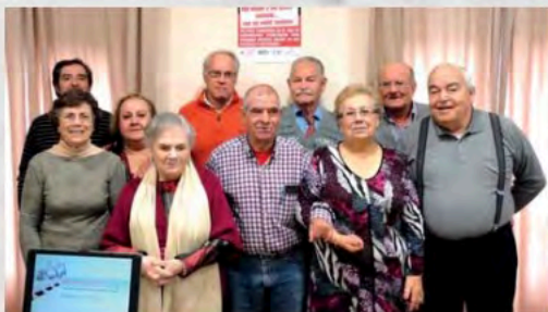
Curso manejo smartphones