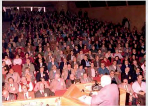
1984-VIII Pleno Comité Confederal