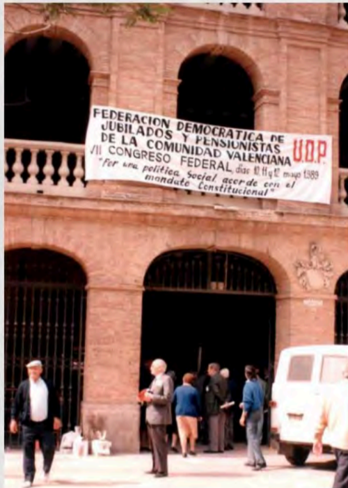
1989 - VII Congreso Federal de la Comunidad Valenciana