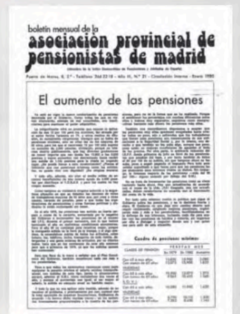
1978: Los primeros boletines de UDP recogen las reivindicaciones de nuestra organización