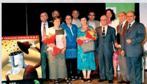
2005 - Entrega de premios en el IV Concurso Literario de UDP