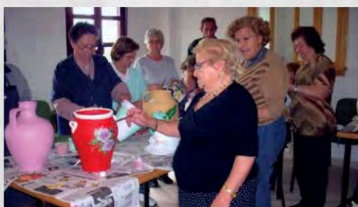
Talleres de manualidades