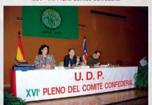
XVI Pleno Comité Confederal en Palma de Mallorca