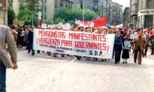
1981 - Manifestación de protesta Miranda de Ebro (Burgos)