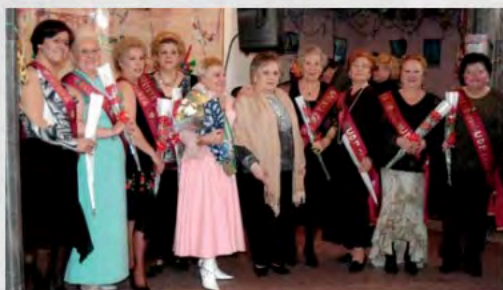
2005 - Carnavales de Cádiz