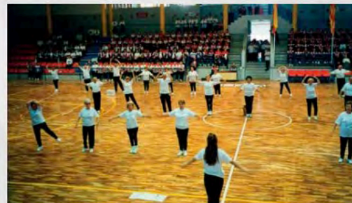
Tablas de gimnasia en Valencia