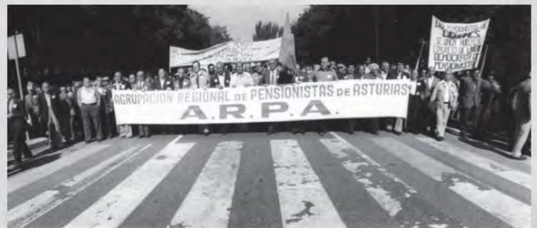
1979 - Manifestación multitudinaria en Madrid