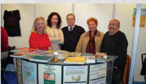
Día voluntariado Alicante