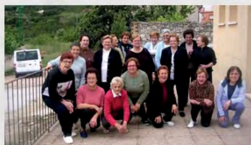
Programa de Animación Rural