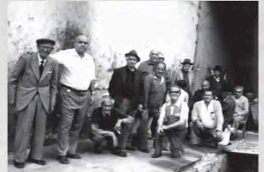
1979 - Asociación Guarteme Las Palmas