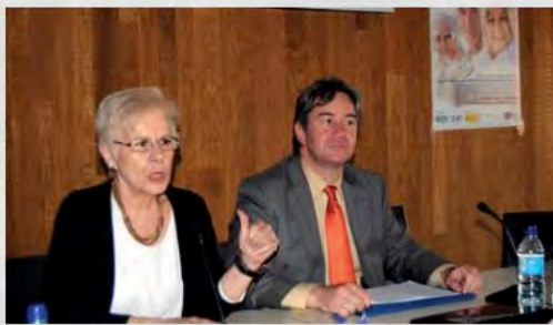
2015 - Jornada sobre cohousing