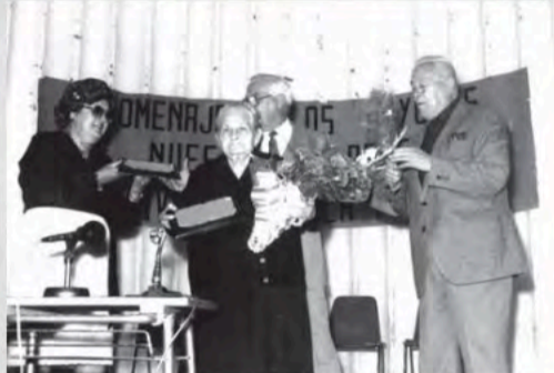
1992-Homenaje a los mas Mayores