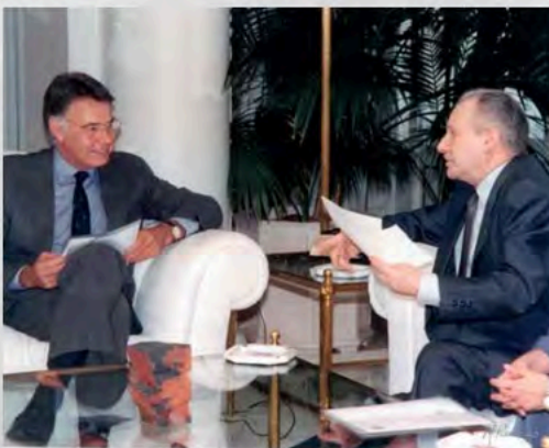
1983 - Entrevista con Felipe González