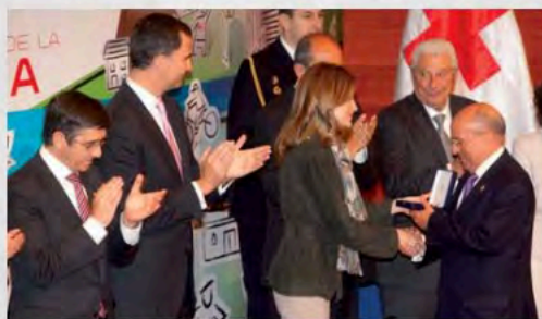
2012 - Entrega a UDP de la Medalla de Oro de la Cruz Roja