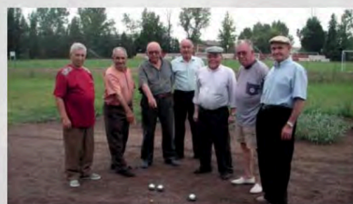
Torneos de petanca