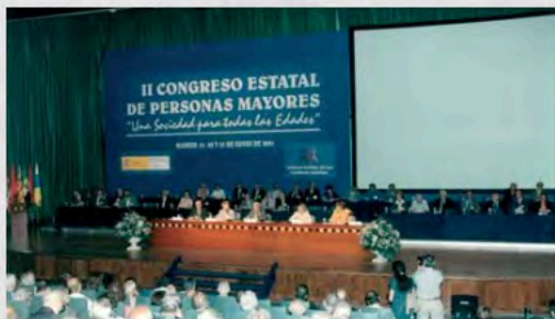
2001-II Congreso Estatal de Personas Mayores