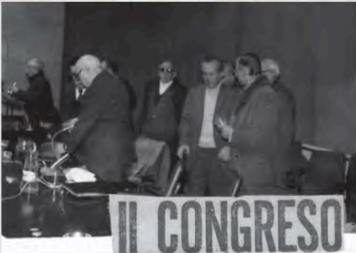
2º Congreso Abril del 1978