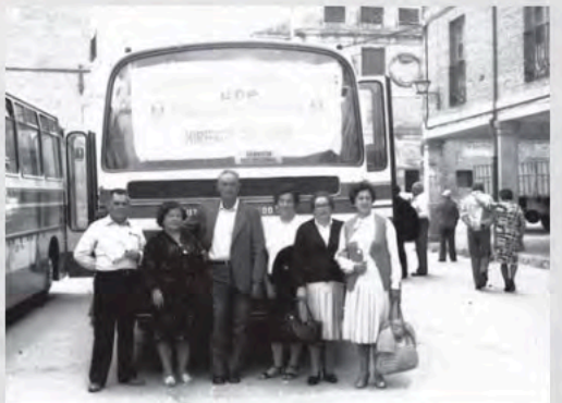
Saliendo de viaje. Miranda de Ebro