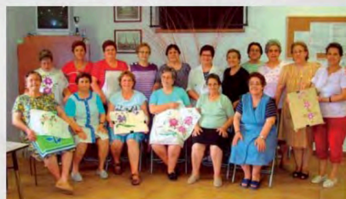
Trabajos manuales de jubiladas de Calzadilla