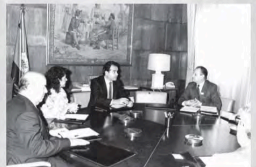
1987 - Reunión con el Ministro de Trabajo y SS