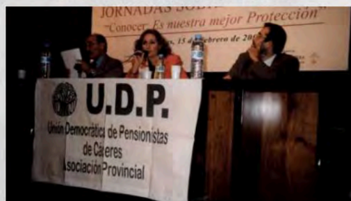
2002 - Jornadas sobre consumo Cáceres