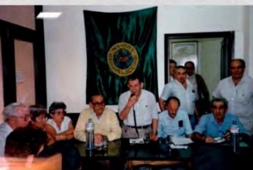
Asamblea UDP de Aranda de Duero