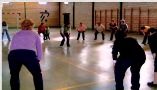
Gimnasia para Mayores