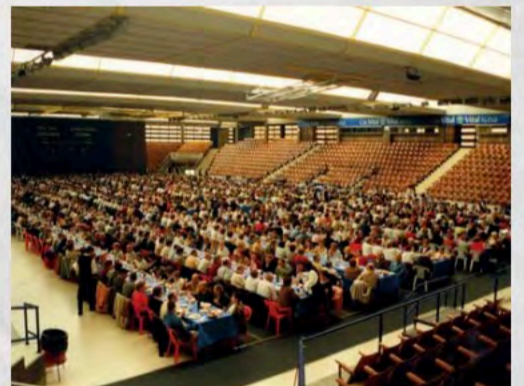
1998 - Día del Jubilado en País Vasco