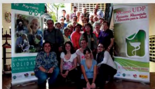
2010 - X Curso Formación de voluntaria