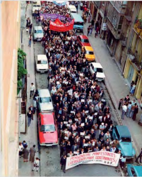
1981-Manifestación en Miranda de Ebro