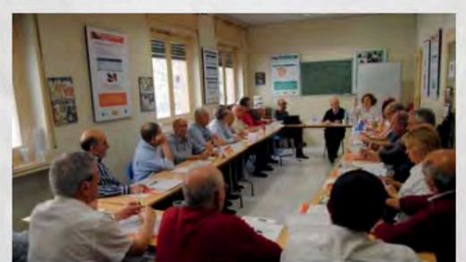
2013 - En la Escuela de Mayores Activos de UDP