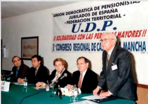
I Congreso Regional UDP Castilla La Mancha