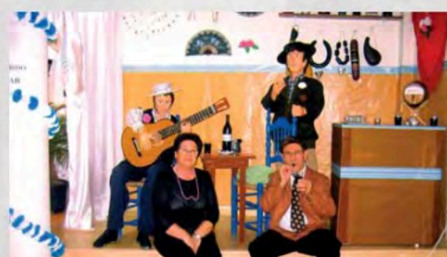
Fiestas en Melilla