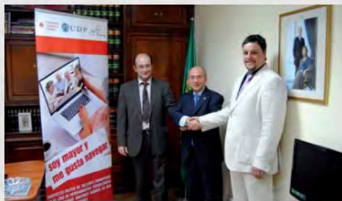
Firma Convenio "Soy Mayor y Me Gusta Navegar"