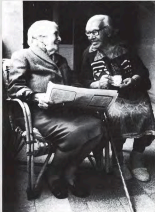
1989 - Dos socias de UDP