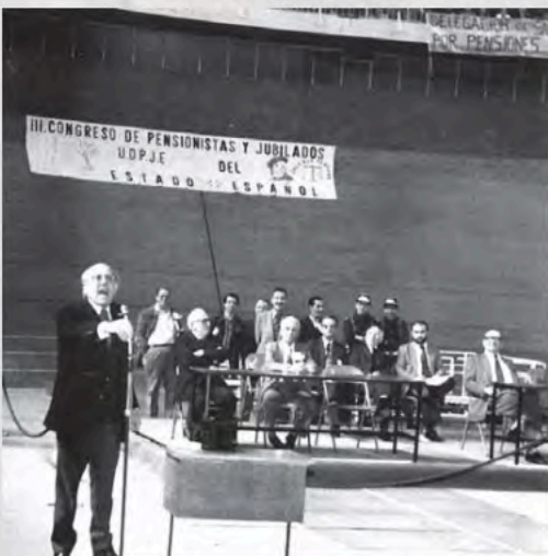
3º Congreso Abril de 1979