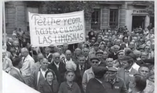
1983 - Concentración, luchando por las pensiones