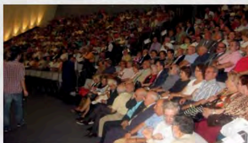
2009 - XL Asamblea General de UDP en Santa Cruz de Tenerife