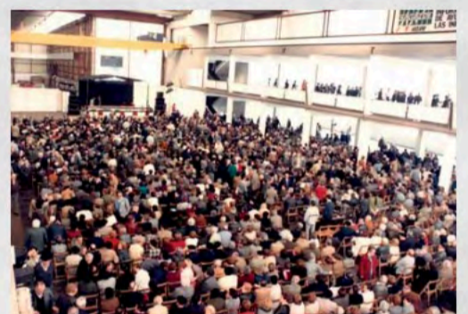
1984 - VIII Pleno Comité Confederal