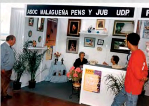
1999 - Stand de la Asociación malagueña de UDP