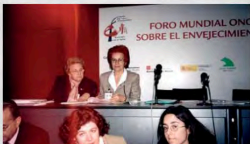
2002 - Foro Mundial ONGs sobre Envejecimiento