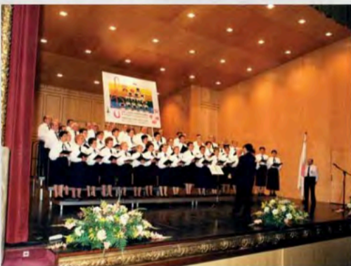
2000 - V Muestra Coral de Euskal Herria - Coral UDP