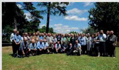
2013 - Asamblea General de UDP en El Escorial