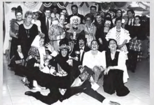
Grupo de teatro de Palma de Mallorca

40 años de UDP UNIÓN DEMOCRÁTICA DE PENSIONISTAS Y JUBILADOS DE ESPAÑA de un País