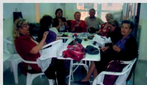
2000 - XV Congreso Confederal en Sevilla