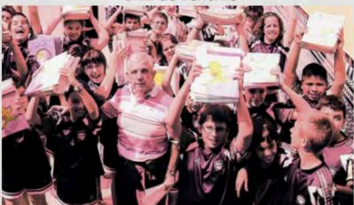
2009 - Campaña solidaria de la Asociación APEJUPO-UDP de Málaga