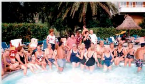
Disfrutando en la piscina