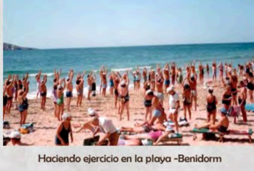
Haciendo ejercicio en la playa -Benidorm