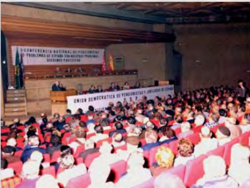
1ª Conferencia Nacional de Pensionistas