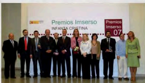
2007 - Premios Inmerso