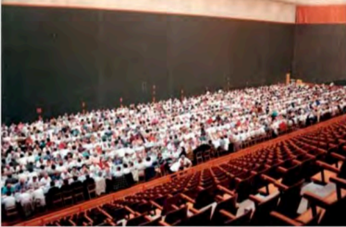
1996 - 3.500 pensionistas en Olimpiadas de Vitoria