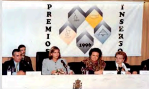
1996 - Premios INERSO