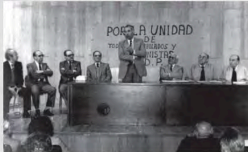
1ª Asamblea, gestando la unidad de la futura UDP