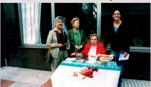
Mesa de sensibilización sobre Voluntariado en A Coruña