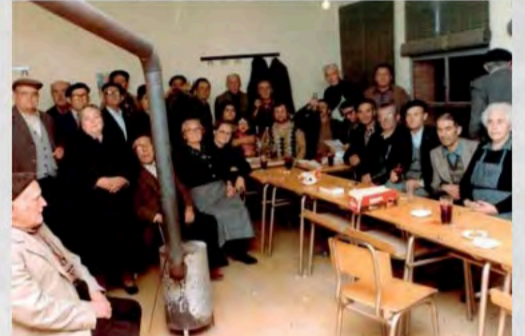
Dia del Pensionista en Sta Cruz de Moya - Cuenca