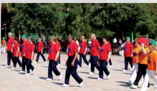
2008 - Olimpiadas Valencia