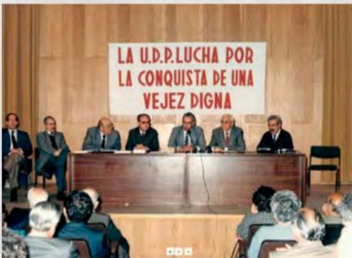
1988 - Asamblea en Albacete