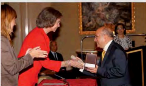
2011 - Entrega de la Cruz de Oro de la Orden Civil de la Solidaridad Social a UDP