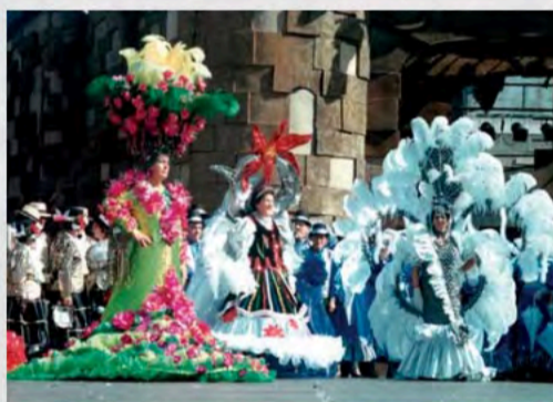
Carnaval Damas de Honor de UDP - Tenerife