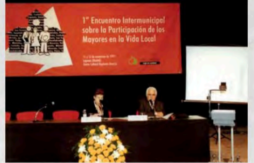
1997 - Participación Mayores en la Vida Local