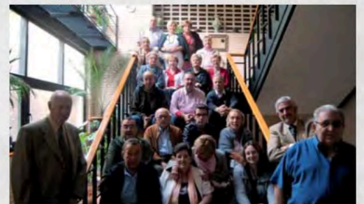
Curso Formacion Voluntariado en El Escorial