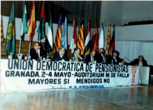
1988 - VIII Congreso Confederal en Granada