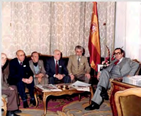
1983-Entrevista con Gregorio Peces Barba