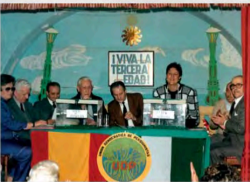
Votaciones en una Asamblea Provincial de UDP