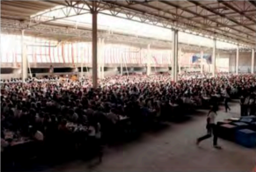
1992 - Jornada en Feria de muestras de Bilbao