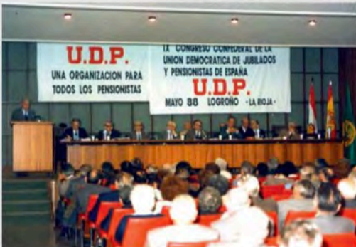
1988 - congreso Logroño