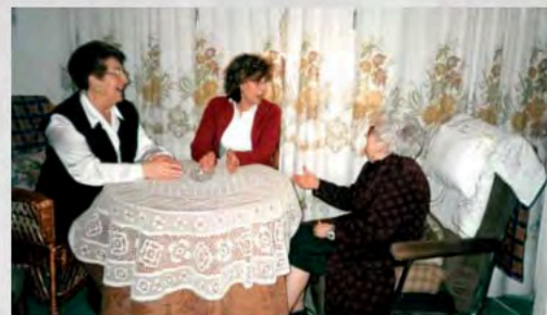
2003 - Lugo-Voluntariado de UDP