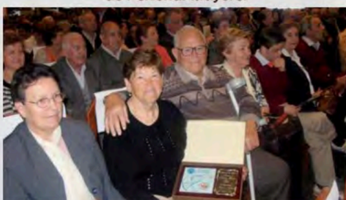
Homenaje a voluntarios en Cuenca