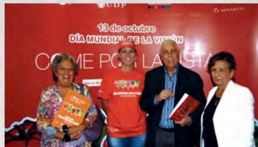
2010 - Día Mundial de la Visión