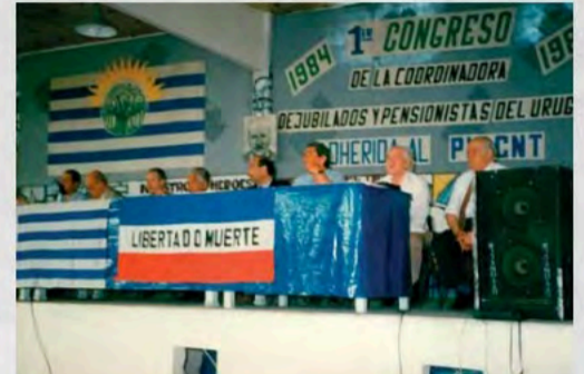
1988 - I Congreso de la Coordinadora Uruguaya