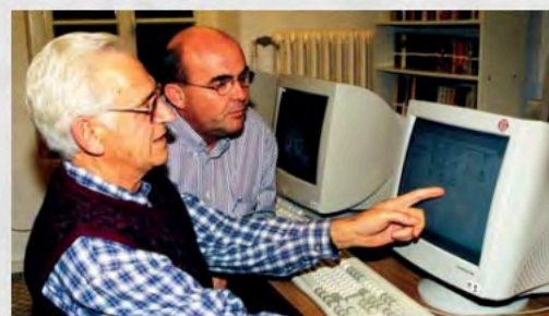
Aprendiendo informática - Asociación de Suiza