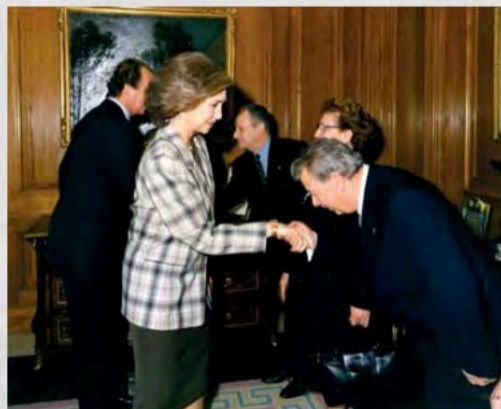
1998 - Recepción con los Reyes