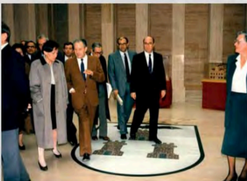
1989 - Con la Ministra de Asuntos Sociales