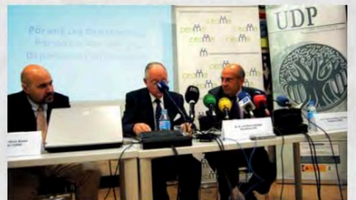
2015-Declaracion conjunta CERMI-CEOMA-UDP