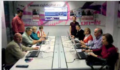
Curso Redes sociales