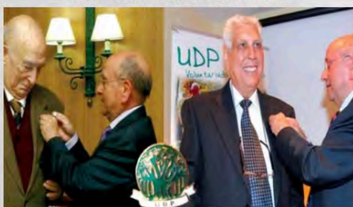
UDP reconoce el compromiso de nuestros compañeros