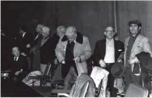
1º Congreso Diciembre de 1977